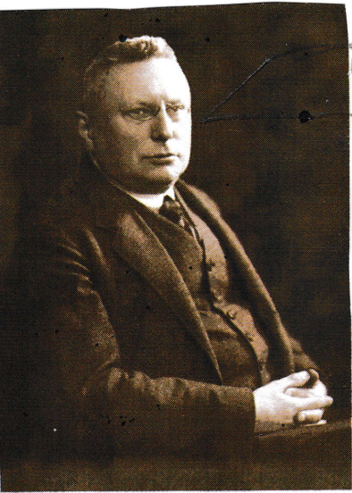
Minister Józef English

① Panowie, mamy już ustawę. Teraz musimy podjąć decyzję co do wydruku.